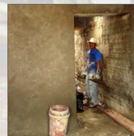
9. Tarrajeo de los muros