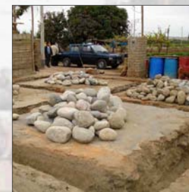
2. Excavación del terreno