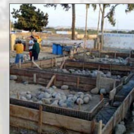
3. Cimientos y sobrecimiento