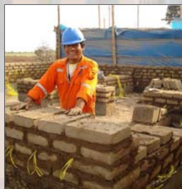
5. Construcción de muros