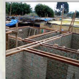
7. Viga collar