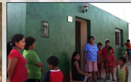
10. Vivienda reconstruida