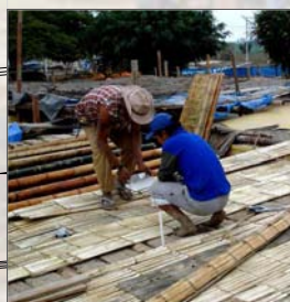
8. Entechado de caña de guayaquil