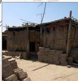
1. Casa existente (Claveles)