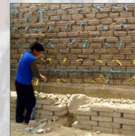
6. Colocación de geomalla